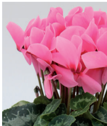
7154 Salmon Eye