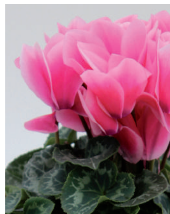
7156 Deep Rose Light Edge